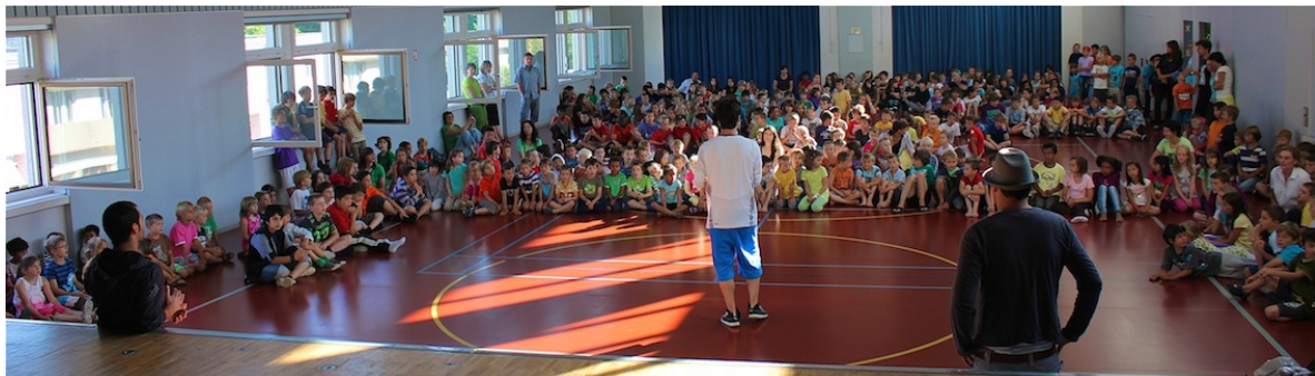
Erfolgreiche Projektwoche zum Schulabschluss 2011 mit den STARBUGS

Konsequenzen und Details siehe Ausführungsbestimmungen, einzusehen bei den Lehrpersonen.