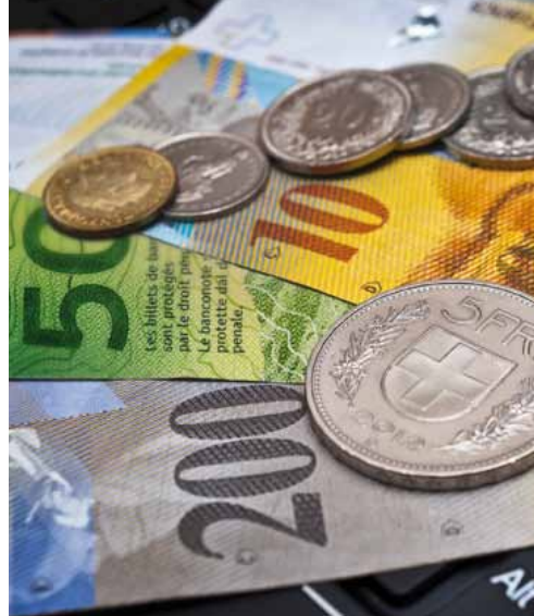
Erhöhte Unterhaltskosten gehen zu Ihren Lasten.