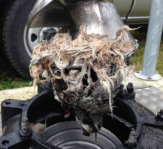
Verstopfte Pumpen, aufwändige Instandstellung.