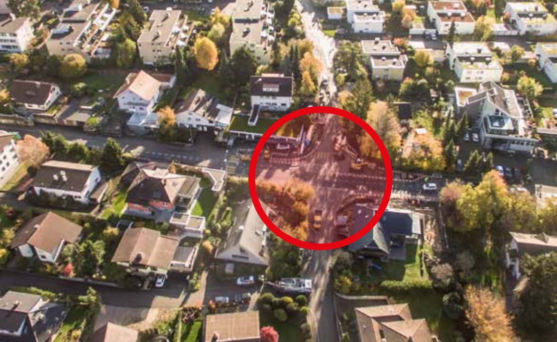
Kreisel Einfahrt Römerstrasse/Blumenrain